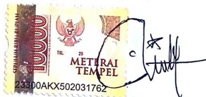
Siti Chusnul Chotimah