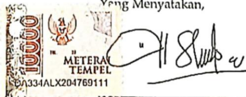
Silvie Laila Nugrahini