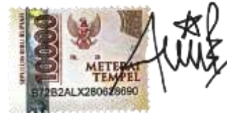
Antiq Kusthon Tiniyyah