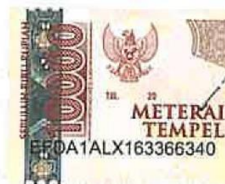
Ita Septiana Fauziah