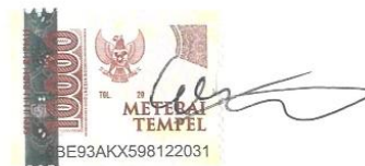
Ervan Lugito Bagaskara