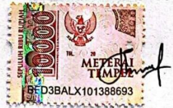
Ervina Nur Afifah