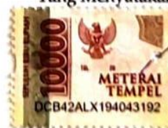
Dyah Ayu Imaningtyas

Tulungagung, 01 Agustus 2024 Yang Menyatakan,