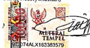
LUKITA SAPI NINGRUM Nama terang dan tanda tangan

Tulungagung, 25 JULI 2024 Yang Menyatakan,