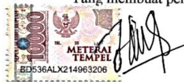
Hilya Lailatuz Zahro