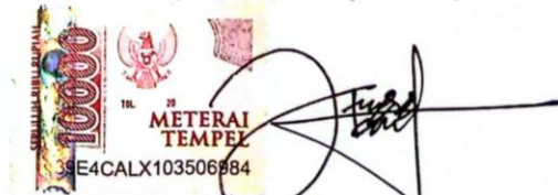
Fitri Nur Alimah