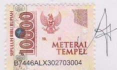
Nurul Azizah Huril Maula

Tulungagung, 6 Januari 2025 Yang Menyatakan,