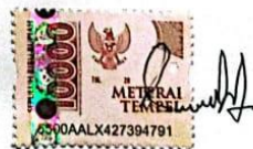
Imdad Tsaaniyatuz Zamani

Tulungagung, 10 Mei 2024 Yang Menyatakan,