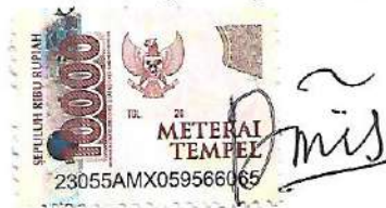
Dini Setyawatir Rohmah

Tulungagung, 14 Juni 2024 Yang Menyatakan,