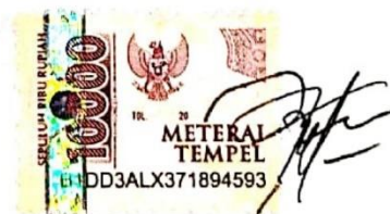
Aziz Ihza Nurfarhan