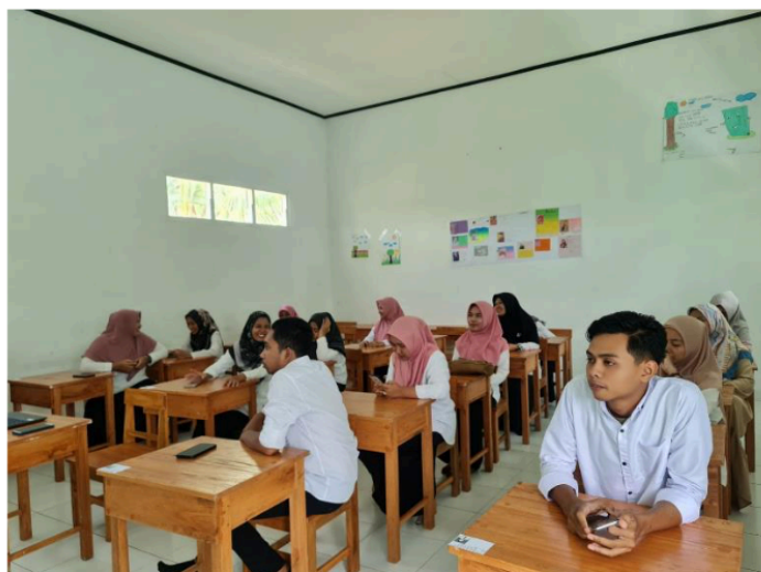
Gambar 2. Antusiasme Peserta dalam Kegiatan Pelatihan Penyusunan Modul Ajar b. Kegiatan 2

Kegiatan selanjutnya pada kegiatan pendampingan penyusunan modul ajar ini adalah merancang konsep modul ajar secara berkelompok. Pada kegiatan 1 peserta sudah memahami tentang konsep pembelajaran di kurikulum Merdeka, serta teknis dalam menyusun modul ajar, pemahaman tersebut menjadi bekal peserta untuk mampu menyusun modul ajar sesuai dengan kebutuhan kelas masing-masing. Pada kegiatan 2 ini pemateri membagi peserta menjadi beberapa kelompok. Pengelompokan didasarkan pada kelas yang diampu. Guru kelas 1 dan 2 menjadi satu kelompok untuk menyusun Modul ajar fase 1, guru kelas 3 dan 4 menjadi satu kelompok untuk menyusun modul ajar fase 2 dan guru kelas 5 dan 6 menjadi satu kelompok untuk menyusun modul ajar fase 3. Pembagian kelompok berdasarkan fase pembelajaran, bertujuan untuk mempermudah peserta dalam menentukan Capaian pembelajaran (CP), tujuan pembelajaran (TP) dan alur tujuan pembelajaran (ATP) yang akan disajikan dalam modul ajar.