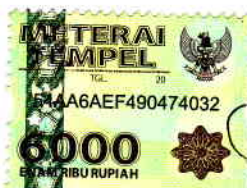
Nur Chamidah Saliq