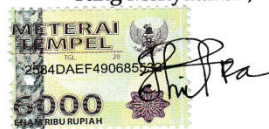
CHINDRA AYU ELITA

Tulungagung, 15 Agustus 2017 Yang Menyatakan,