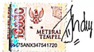
Rizka Bica Indriyani

Tulungagung, 5 Juni 2025 Yang Menyatakan,