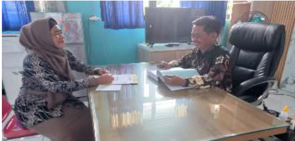
Gambar 4.5 : Wawancara dengan Kepala SMA Negeri 2 Nganjuk