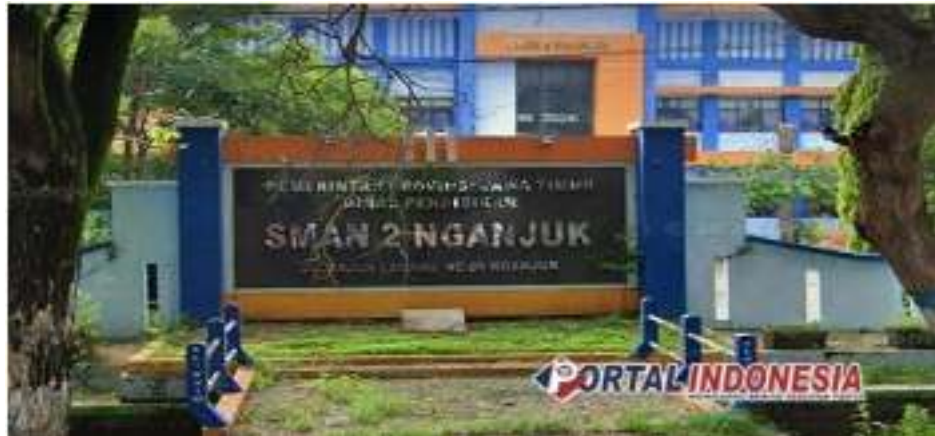
Gambar 4.4 : SMA Negeri 2 Nganjuk