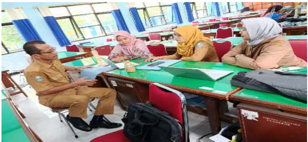
Gambar 4.7 : Kegiatan Pra-Supervisi Akademik SMA Negeri 2 Nganjuk

Hal ini terdokumentasi dalam gambar berikut ini.