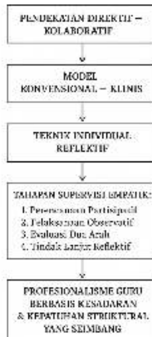
Gambar 1 Model Analisis Supervisi Akademik Integratif

Model di atas menggambarkan bahwa hasil analisis penelitian ini tidak hanya mengontraskan dua praktik supervisi akademik yang berbeda, tetapi juga menawarkan blended framework yang dapat menjadi rujukan praktis bagi lembaga pendidikan lain. Supervisi akademik yang efektif sebaiknya tidak berhenti pada tahap pengawasan, melainkan berkembang menjadi coaching system yang berorientasi pada peningkatan kapasitas guru secara menyeluruh. Dalam konteks ini, kepala sekolah berperan bukan sekadar evaluator, tetapi juga sebagai mentor dan fasilitator pembelajaran profesional.