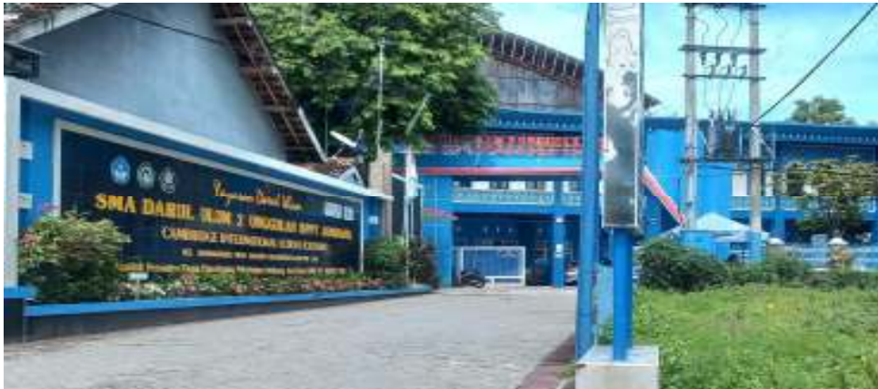
Gambar 4.1. : SMA Darul Ulum 2 Unggulan BPPT Jombang CIS