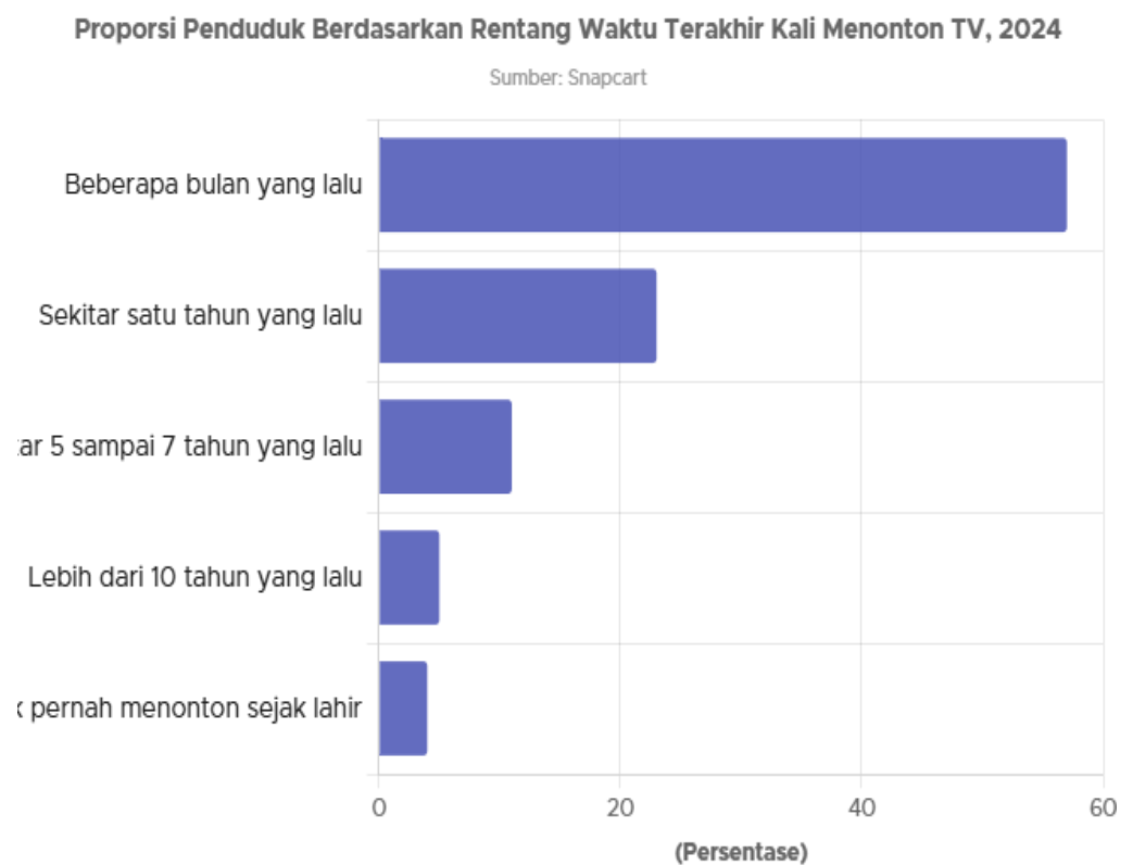
Gambar 1.2 survei snapchart

Data lain yang menunjukkan bahwa penonton televisi menurun adalah hasil survei snapcart. Hal ini menunjukkan bahwa televisi lokal tidak lagi menjadi pilihan utama bagi Masyarakat.