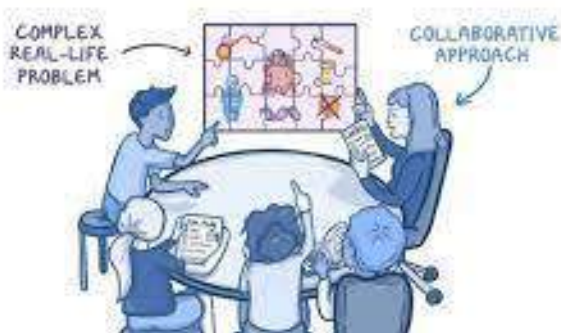
Gambar 5.1. Keterlibatan Siswa Dalam PBL dengan Etnomatematika

Etnomatematika juga berperan dalam membantu siswa mengembangkan keterampilan berpikir kritis (Herlambang et al., 2020). Dalam PBL, siswa diharuskan memecahkan masalah yang melibatkan data-data budaya lokal dan kontekstual. Proyek-proyek ini mendorong siswa untuk berpikir analitis dan kreatif, sehingga mereka tidak hanya memahami konsep matematika, tetapi juga mengembangkan keterampilan pemecahan masalah yang lebih baik.