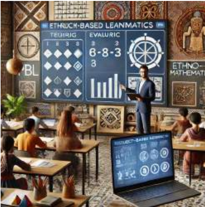
Gambar 6.2 Pemanfaatan Data dan Teknologi untuk Penilaian PBL yang terintegrasi Etnomatematika

Terakhir, guru perlu memperbarui pengetahuan dan keterampilan mereka melalui pelatihan dan studi lanjut. Ningsih & Siti (2021) menegaskan pentingnya pelatihan guru untuk memahami praktik terbaik dalam PBL yang terintegrasi etnomatematika dan mengikuti perkembangan terbaru dalam model pembelajaran ini. Guru yang terus meningkatkan kompetensi mereka akan lebih siap menghadapi tantangan dalam implementasi PBL yang terintegrasi etnomatematika.