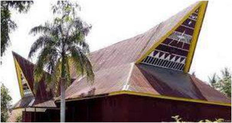
Gambar 1.2 Rumah Adat Bagas Godang Panyabungan Tonga (Aziz dan Hasibuan, 2024)

menyoroti bahwa pola geometris pada bangunan tradisional dapat menjadi bahan ajar yang efektif untuk mengajarkan konsep-konsep seperti simetri, bentuk, dan pola. Dengan demikian, pembelajaran menjadi lebih kontekstual dan menarik.