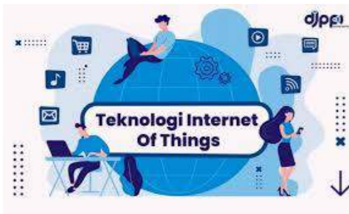
Gambar 4.2 Peran Teknologi dalam HOTS ( https://djppi.kominfo.go.id/ )

Selain itu, teknologi memungkinkan siswa untuk mengakses informasi secara independen, yang dapat memperkuat keterampilan berpikir tingkat tinggi mereka (Sutrisno & Wibowo, 2023). Siswa dapat menggunakan berbagai platform digital, seperti media sosial, situs web, dan aplikasi edukasi, untuk mengeksplorasi informasi, mengkaji data, dan menganalisis topik-topik kompleks. Dengan cara ini, siswa tidak hanya sekadar menerima informasi dari guru, tetapi juga dapat mencari dan mengevaluasi sumber daya sendiri, yang mendorong keterampilan berpikir kritis dan analitis. Teknologi membantu siswa untuk mengembangkan kemampuan berpikir reflektif, memperkuat kemampuan mereka dalam merancang strategi pemecahan masalah, dan mengaplikasikan pengetahuan dalam konteks yang lebih luas.