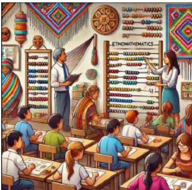
Gambar 2.1 Pembelajaran Etnomatematika

Dalam jangka panjang, implementasi etnomatematika berpotensi meningkatkan prestasi akademik siswa. Dengan pemahaman yang lebih baik tentang matematika dalam konteks budaya mereka, siswa cenderung lebih terlibat dalam pembelajaran, merasa percaya diri, dan mampu mengatasi tantangan matematika dengan lebih efektif. Oleh karena itu, etnomatematika dapat menjadi pendekatan yang sangat bermanfaat dalam pembelajaran matematika untuk membangun keterampilan, motivasi, dan rasa identitas budaya yang kuat pada siswa.