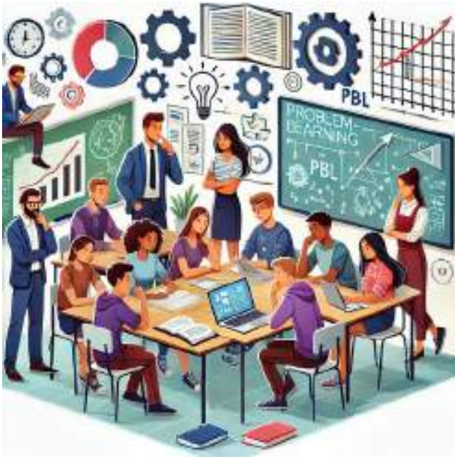
Gambar 3.1. Siswa Bekerja Sama dalam Kelompok dalam PBL

Menurut Thomas (2000), PBL memberikan siswa peluang untuk mempraktikkan keterampilan yang relevan dengan dunia kerja, seperti pengelolaan waktu, kolaborasi, dan komunikasi. Hal ini sejalan dengan tujuan pembelajaran abad ke-21 yang menekankan pentingnya keterampilan literasi digital dan kemampuan berpikir kompleks (Bell, 2020). Dalam PBL, siswa terlibat langsung dalam perencanaan, pelaksanaan, dan evaluasi proyek, sehingga mereka tidak hanya mengembangkan pemahaman konsep tetapi juga memperkuat keterampilan pemecahan masalah (Larmer & Mergendoller, 2010).