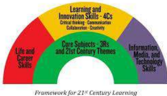
Gambar 1.3 HOTS dalam Pembelajaran

Teknologi juga memfasilitasi guru dalam merancang pembelajaran berbasis HOTS dengan cara yang lebih kreatif dan inovatif. Menurut Choy & Cheah (2021), penggunaan alat digital seperti aplikasi pembelajaran, simulasi, dan permainan edukatif memungkinkan siswa untuk menyelesaikan masalah yang kompleks. Hal ini membantu mengasah keterampilan HOTS, seperti analisis, sintesis, dan evaluasi, yang penting dalam konteks dunia kerja yang dinamis. Dengan adanya teknologi, guru dapat mengintegrasikan metode pembelajaran interaktif dan berbasis proyek, sehingga siswa tidak hanya belajar teori, tetapi juga menerapkannya dalam situasi yang lebih nyata.