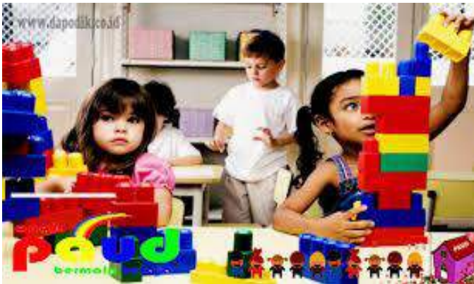
Gambar 4.3. Strategi Mengembangkan HOTS pada Siswa ( https://www.dapodik.co.id/ )

HOTS ( Higher Order Thinking Skills ) adalah kemampuan berpikir tingkat tinggi yang melibatkan keterampilan seperti analisis, sintesis, dan evaluasi. Mengembangkan kemampuan ini pada siswa sangat penting untuk mempersiapkan mereka menghadapi tantangan di masa depan. Salah satu strategi utama untuk mengembangkan HOTS adalah melalui pendekatan pembelajaran berbasis pertanyaan. Menurut Azizi & Fauzi (2021), pendekatan ini melibatkan siswa dalam proses pembelajaran dengan memacu mereka untuk mengajukan pertanyaan yang mendalam dan reflektif. Hal ini membantu siswa mengembangkan kemampuan untuk berpikir kritis dan memecahkan masalah dengan lebih efektif.