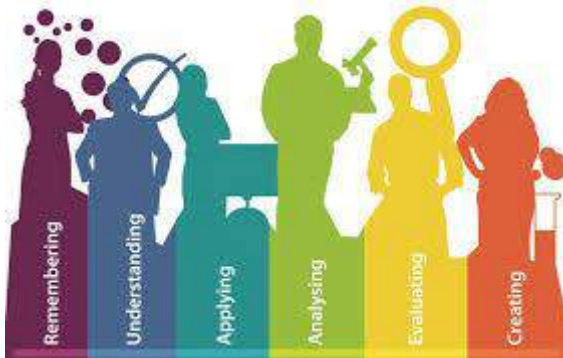
Gambar 4.1. HOTS dalam Pendidikan yang Inovatif

Implementasi HOTS dalam pendidikan membutuhkan strategi pembelajaran yang inovatif, seperti proyek berbasis masalah, diskusi kelompok, dan pembelajaran berbasis konteks. Pendekatan ini menekankan kolaborasi dan keterlibatan aktif siswa, di mana mereka tidak hanya menghafal tetapi juga memahami dan menerapkan pengetahuan dalam situasi nyata. HOTS juga mendorong pengembangan keterampilan komunikasi dan kerjasama, yang penting dalam menyelesaikan masalah kompleks. Oleh karena itu, upaya untuk meningkatkan HOTS di dalam pendidikan harus diarahkan pada pengembangan aktivitas yang mendorong berpikir kritis, pemecahan masalah, dan kemampuan bekerja lintas disiplin, guna mempersiapkan siswa untuk menghadapi tantangan global di masa depan.