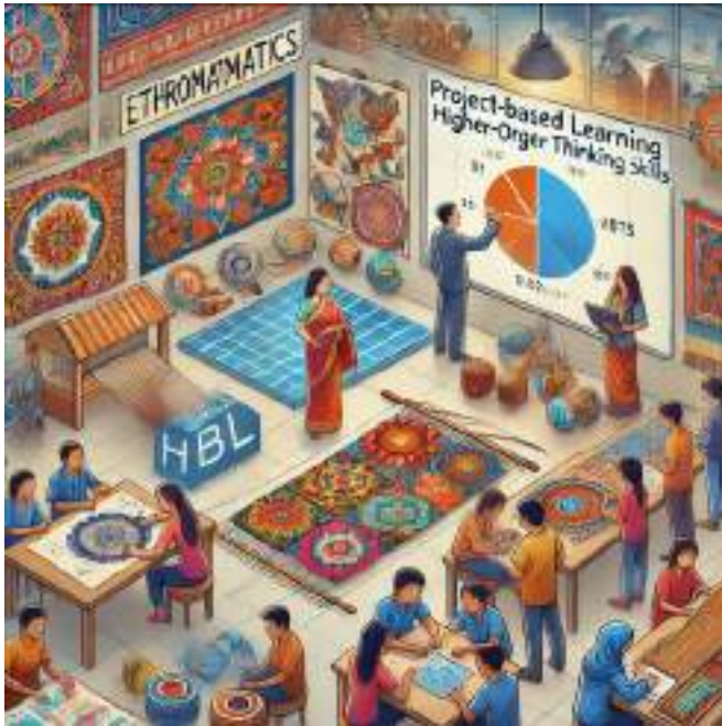
Gambar 5.2. Pembelajaran PBL yang Terintegrasi Etnomatematika untuk Meningkatkan HOTS

Keberhasilan PBL yang terintegrasi etnomatematika juga dipengaruhi oleh keberagaman metode dan strategi pembelajaran yang digunakan. Menurut Ahmad et al. (2023), penggunaan metode seperti diskusi kelompok, simulasi, dan proyek kolaboratif dapat meningkatkan keterampilan HOTS siswa. Model PBL yang terintegrasi etnomatematika yang fleksibel memungkinkan guru untuk menyesuaikan pembelajaran dengan kebutuhan dan konteks siswa, sehingga meningkatkan efektivitas proses pembelajaran (Hamid & Siregar, 2022).