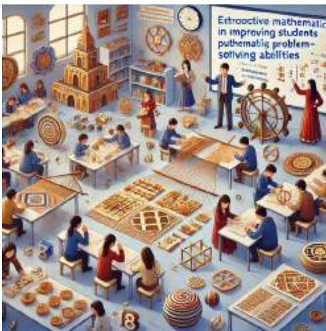
Gambar 2.2. Model Pembelajaran berbasis Etnomatematika

pembelajaran matematika memotivasi siswa untuk terlibat aktif, sehingga meningkatkan minat belajar mereka. Penekanan pada konteks budaya ini membantu siswa memahami relevansi matematika dalam kehidupan sehari-hari mereka. Misalnya, penggunaan masalah yang berhubungan dengan kegiatan pertanian, perdagangan, atau kehidupan masyarakat dapat memperdalam pemahaman konsep-konsep seperti pecahan, persentase, dan geometri.