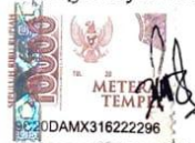
Tusya Serdania Cahyaningrum