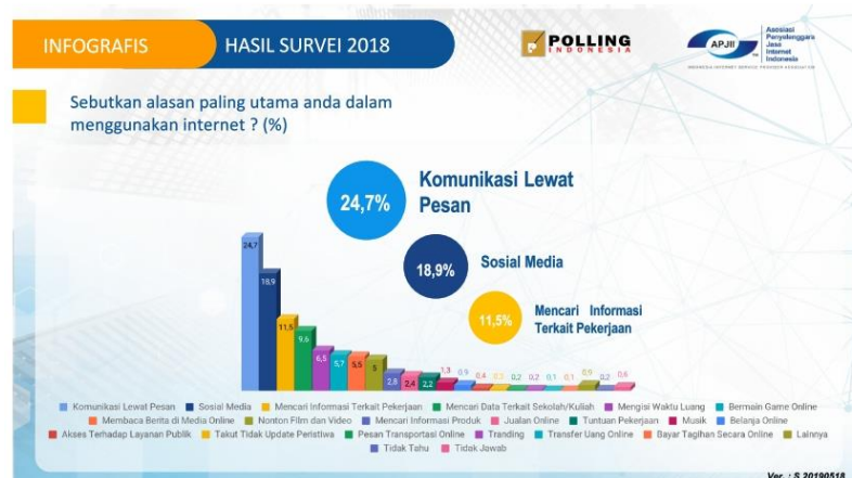
Gambar 1. 2 APJII Hasil Survei pada tahun 2018 tentang alasan penggunaan internet

Survei Internet APJII - Diunduh untuk Alif Fatkhur Rizki (aliprsk11@gmail.com)