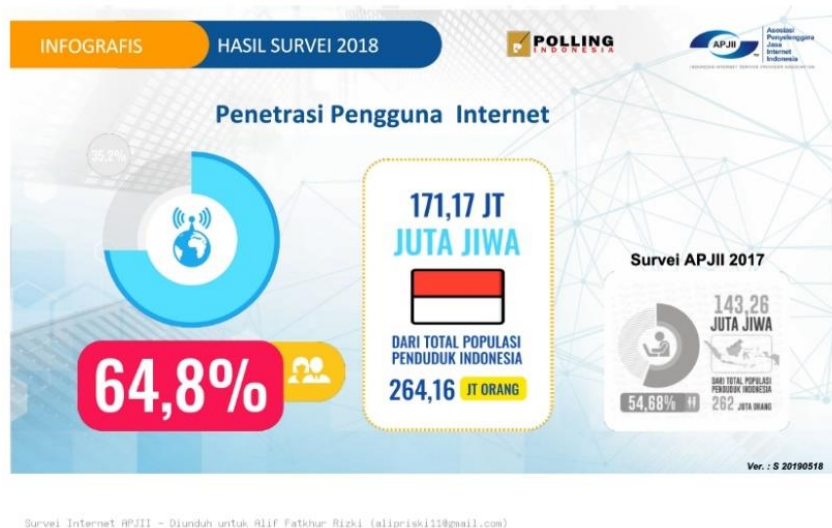
Gambar 1. 1 APJII Hasil Survei Penetrasi Internet Pada Tahun 2018

Perubahan perilaku konsumen informasi menjadi salah satu faktor utama untuk mulai berkembang dengan cepat terhadap berkembangnya teknologi yang ada, menurut data Asosiasi Penyelenggara Jasa Internet Indonesia (APJII) jumlah pengguna internet di Indonesia telah mengalami peningkatan yang signifikan semenjak 2018.