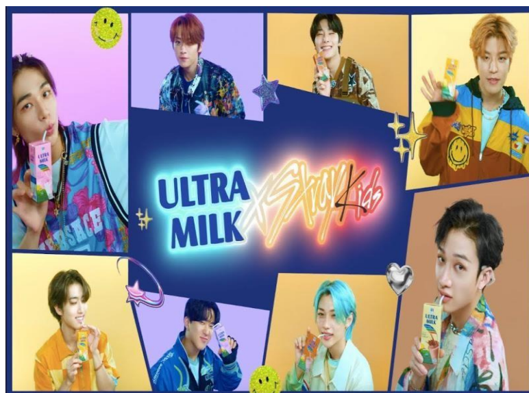
Gambar 1.2. Brand Ambassador terbaru Susu Ultra Milk

Fenomena korean wave yang sedang populer dikalangan masyarakat Indonesia pada saat ini salah satunya yakni musik pop atau K-pop yang dapat mempengaruhi gaya hidup serta cara berpikir masyarakat. Idol-idol Korea dikenal sangat menarik terutama yakni dari segi penampilan, fisik, serta bakat yang dimiliki, sehingga dapat menjadikan beberapa perusahaan di Indonesia menggunakan brand ambassador dari idol-idol Korea, salah satunya yaitu brand susu Ultra Milk yang kali ini bekerjasama dengan idol boyband Korea yakni Stray Kids (Salsabila & Purnamasari, 2023).