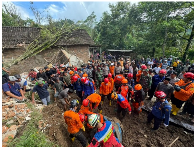
Gambar 3 Tanah longsor di Trenggalek

Kabupaten Trenggalek juga mengalami peningkatan intensitas bencana dalam beberapa tahun terakhir. Berdasarkan laporan BPBD yang dikutip media, terjadi 58 kejadian bencana dalam waktu 12 hari pada tahun 2025, yang mengakibatkan korban jiwa serta kerusakan infrastruktur.