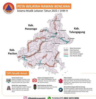
Gambar 2 Peta Wilayah Rawan Bencana Kabupaten Trenggalek

Data ini menegaskan bahwa Trenggalek merupakan salah satu daerah dengan tingkat kerentanan tinggi terhadap bencana hidrometeorologi dan geologi. Dampak yang ditimbulkan tidak hanya berupa kerusakan fisik, tetapi juga menyebabkan hilangnya mata pencaharian, meningkatnya kemiskinan, serta melemahnya daya tahan sosial-ekonomi masyarakat.