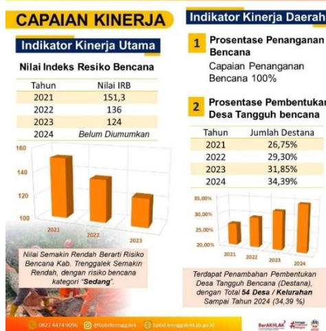
Gambar 5 Kontribusi Penanganan Bencana