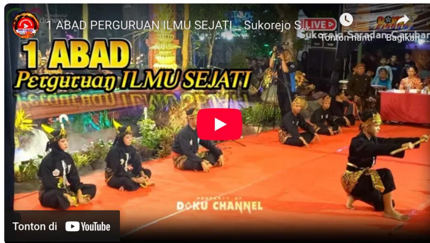
Figure 5 Tangkapan layar video peringatan 1 abad Perguruan Ilmu Sejati