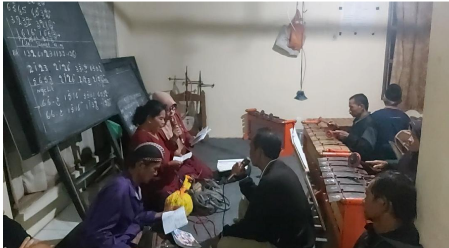
Figure 7 Pelatihan karawitan di salah satu anggota perguruan Ilmu Sejati di Tulungagung

menghadirkan diri di dalam jejaring digital. Mereka melebur, berkontestasi secara makna dan kehadiran.