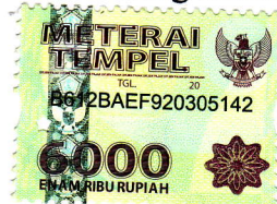
Lely Chusnul Laily