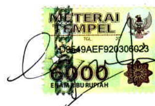
Egin Ira Puspita