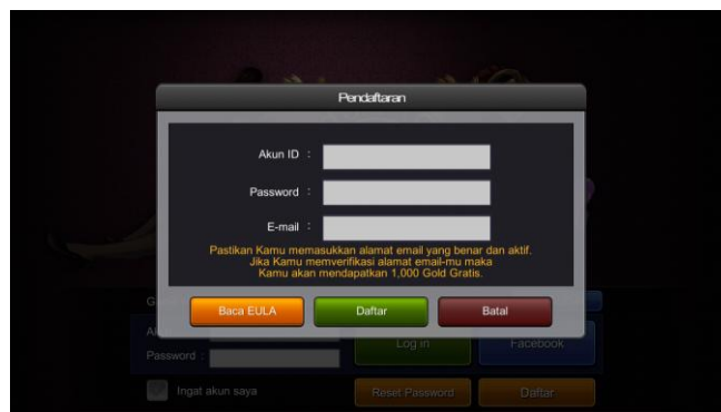
Gambar 3.12 Screenshot dari Game Online Indoplay

Setelah pemain sudah membuka aplikasi Game Online Indoplay, pemain bisa langsung pilih atau klik menu Daftar . Setelah itu akan langsung dialihkan pada menu pendaftaran yang pemain harus mengisi Akun ID , Passwod , dan Email . Didalam kolom Akun ID pengguna harus mengisi nama yang belum digunakan oleh pemain lain, buatlah password dan masukkan password baru tersebut pada kolom Passwod , lalu masukkan alamat Email yang aktif pada kolom Email , dan pilih Daftar .