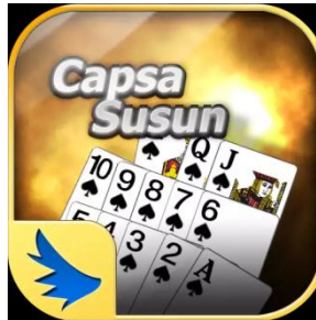
Gambar 3.2 Logo Game Online Indoplay Capsa Susun

Dalam Game Online Indoplay ini terdapat berbagai macam game sebagai berikut: