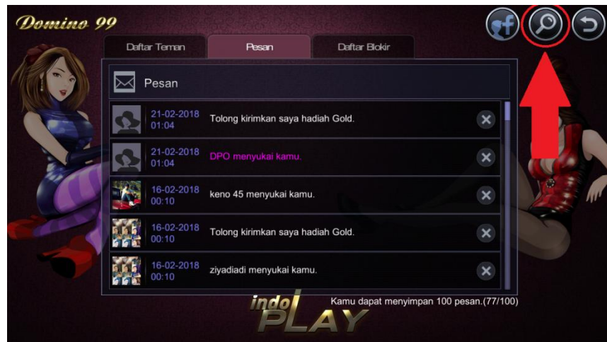
Gambar 3.21 Screenshot dari Game Online Indoplay