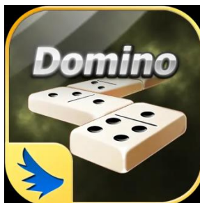
Gambar 3.6 Logo Game Online Indoplay Domino

Domino terdiri dari 28 kartu. Setiap Kartu terdiri dari 2 sisi, dan setiap sisi memiliki 0 sampai 6 titik. Domino dapat dimainkan oleh 2 sampai 4 orang pemain. Domino adalah permainan yang cukup sederhana tetapi dibutuhkan strategi dan keberuntungan untuk menang.