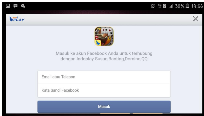
Gambar 3.11 Screenshot dari Game Online Indoplay

Setelah pemain sudah membuka aplikasi Game Online Indoplay, pemain bisa langsung pilih atau klik menu Daftar . Setelah itu akan langsung dialihkan pada menu pendaftaran yang pemain harus mengisi Akun ID , Passwod , dan Email . Didalam kolom Akun ID pengguna harus mengisi nama yang belum digunakan oleh pemain lain, buatlah password dan masukkan password baru tersebut pada kolom Passwod , lalu masukkan alamat Email yang aktif pada kolom Email , dan pilih Daftar .