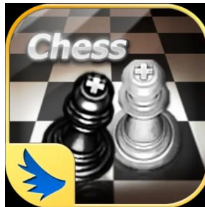
Gambar 3.7 Logo Game Online Indoplay Chess

Catur adalah permainan yang dimainkan 2 orang. Setiap pemain mengontrol 16 bidak catur - Hitam dan Putih. Putih memulai terlebih dahulu, lalu pemain berjalan secara bergantian. Memainkan catur jauh melebihi daripada hanya berjalan sesuai aturan. Memerlukan banyak strategi dan ide seperti materi bidak, ruang, perkembangan arah permainan dan tentu saja keselamatan Bidak Raja. 1