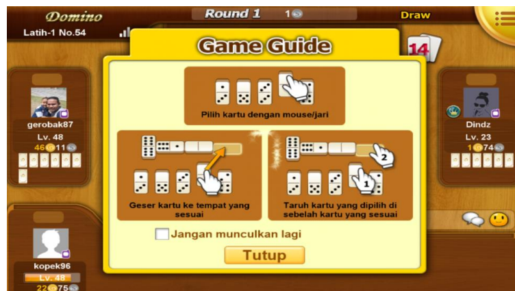
Gambar 3.20 Screenshot dari Game Online Indoplay

Dalam permainan domino terdiri dari 28 kartu. Setiap Kartu terdiri dari 2 sisi, dan setiap sisi memiliki 0 sampai 6 titik. Domino dapat dimainkan oleh 2 sampai 4 orang pemain. Cara mainnya hanya dengan cara mengurutkan berdasarkan kartu yang keluar. Contoh apabila keluar kartu dengan jumlah titik 6 (enam), maka pemain selanjutnya juga harus mengeluarkan kartu yang pada salah satu sisi nya terdapat 6 (enam) titik. Pemain pertama yang menghabiskan seluruh kartu yang dimilikinya adalah pemenang dari permainan ini.