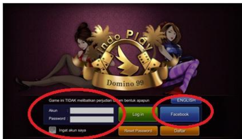
Gambar 3.14 Screenshot dari Game Online Indoplay

Diawali dengan membuka aplikasi Game Online Indoplay yang sudah didownload pada Play Store pada Smartphone. Setelah membuka pemain langsung bisa Log In dengan 2 (dua) cara yaitu dengan menggunakan Facebook dan juga bisa menggunakan Log In Email.