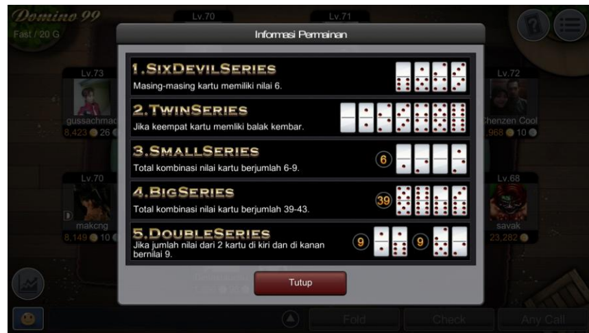
Gambar 3.19 Screenshot dari Game Online Indoplay

Memilih kanal terlebih dahulu merupakan cara awal memainkan pada seluruh Game Online Indoplay. Pada Game Online Indoplay domino juga terdapat 4 (empat) kanal atau rungan seperti pada Game Online Indoplay lainnya yaitu: