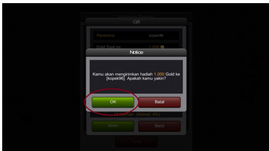
Gambar 3.25 Screenshot dari Game Online Indoplay

Pilihlah OK , apabila pemain sudah memasukkan nama tujuan transfer dengan benar dan nominal transfer dengan benar. Dan pemain tujuan transfer langsung bisa melihat pada Kotak Hadiah . Apabila transfer benar maka akan muncul pada Kotak Hadiah .