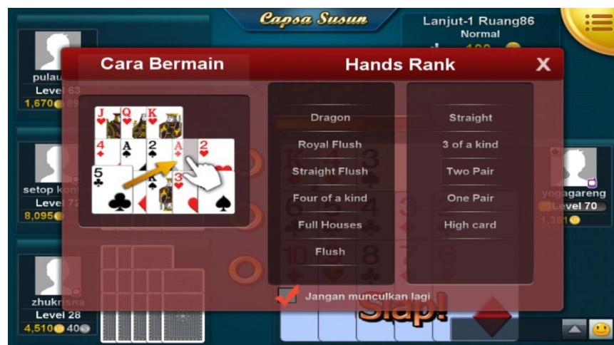
Gambar 3.16 Screenshot dari Game Online Indoplay

Dengan susunan kartu seperti pada gambar dibawah: