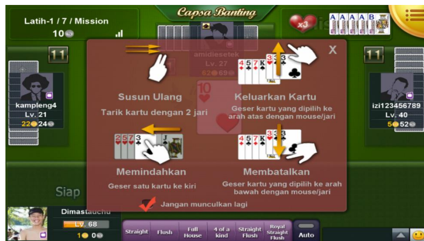
Gambar 3.18 Screenshot dari Game Online Indoplay

Setiap pemain diberikan 13 kartu, dan pemenang adalah pemain yang pertama kali menghabiskan kartu ditangannya. Pemain yang memiliki kartu paling rendah (3 Wajik) memulai permainan terlebih dahulu, lalu pemain berjalan bergantian dan menggunakan strategi untuk mengalahkan lawan mereka dalam beberapa ronde.