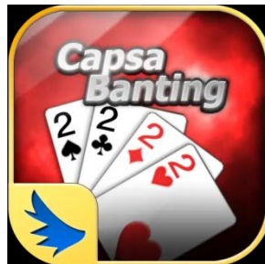
Gambar 3.4 Logo Game Online Indoplay Capsa Banting

Capsa Banting adalah permainan kartu yang sangat populer dan sangat adiktif yang dimainkan hampir diseluruh dunia. Setiap pemain diberikan 13 kartu, dan pemenang adalah pemain yang pertama kali menghabiskan kartu ditangannya. Pemain yang memiliki kartu paling rendah (3 Wajik) memulai permainan terlebih dahulu, lalu pemain berjalan bergantian dan menggunakan strategi untuk mengalahkan lawan mereka dalam beberapa ronde dengan singles, pair/doubles, Tris/triples, Straight/Seri, dan Boms. Mango Capsa Banting juga sangat terkenal di Negara-Negara lain dengan nama Big 2 (Big Two).