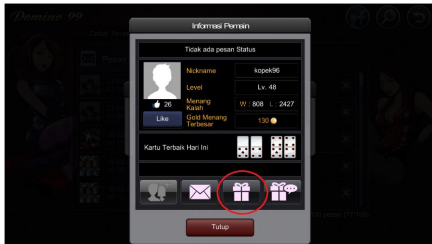
Gambar 3.23 Screenshot dari Game Online Indoplay

Setelah peain sudah memsukkan nama dengan benar dan mencari, maka akan muncul akun Indoplay tujuan, dan pilihlah icon Hadiah .