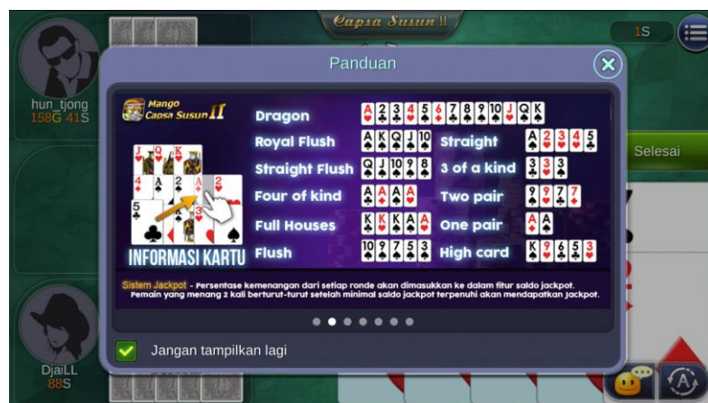
Gambar 3.17 Screenshot dari Game Online Indoplay

Susunan kartu yang harus dimainkan sama persis dengan capsa susun, yang membedakan hanyalah permainan nya lebih lama karena harus bertaruh selama 5 (lima) ronde.