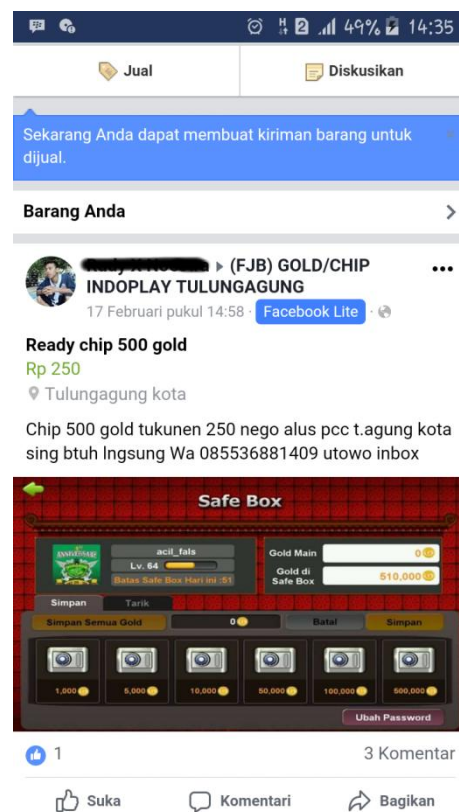
Gambar 3.8 Screenshot Group Jual Beli Chip Indoplay Facebook

Disitulah terjadinya kesepakatan baik mengenai harga pasaran chip (pengganti uang dalam game online) dan juga terjadi interaksi jual beli antara pengguna facebook dan pengguna Game Online Indoplay. 5