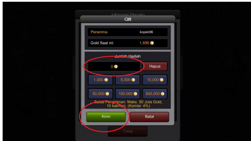
Gambar 3.24 Screenshot dari Game Online Indoplay