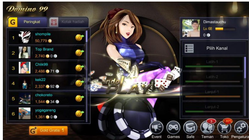
Gambar 3.15 Screenshot dari Game Online Indoplay

Semua jenis permainan yang disediakan oleh Game Online Indoplay memiliki fasilitas yang sama yaitu: