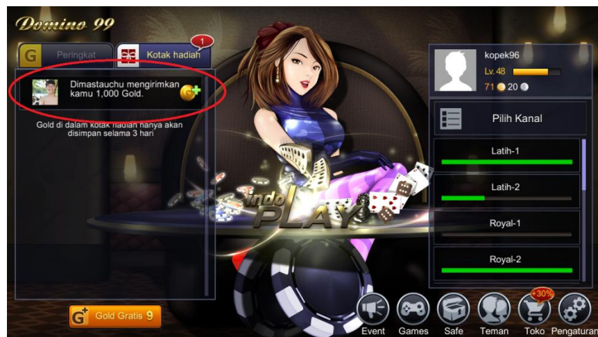
Gambar 3.26 Screenshot dari Game Online Indoplay

Fasilitas transfer yang disediakan oleh Indoplay memiliki batasan yaitu 10x transfer dan 50 juta Gold atau chip dalam satu hari. Dalam setiap satu hari sekali akan direset dan akan kembali.