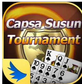
Gambar 3.3 Logo Game Online Indoplay Capsa Susun

Permainan kartu yang dapat dimainkan oleh 2, 3, atau 4 pemain. Kartu yang digunakan adalah kartu standard remi (52 kartu). Setiap pemain dibagikan 13 kartu. Setiap pemain diharuskan menyusunnya menjadi 3 Grup kartu : 1 Grup terdiri dari 3 kartu (Susunan depan), dan 2 grup yang terdiri masing-masing 5 kartu (Susunan tengah dan belakang). Setelah tersusun, masing-masing pemain membandingkan masing-masing grup dari kartunya. Setiap grup yang memenangkan akan memberikan poin berdasarkan tingkatan ranking kartu antar pemain. Pembayaran berdasarkan total point dan ranking dari setiap pemain pada akhir ronde.