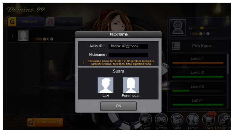
Gambar 3.13 Screenshot dari Game Online Indoplay

Setelah pemain sudah mendaftar melalui Facebook atau Email dan sudah pilih atau klik Daftar , lalu pemain akan dialihkan pada kolom pengisian Nickname dengan pengisian nama yang belum digunakan pemain lain dan juga memilih jenis kelamin laki atau perempuan pada akun pemain. Sesudah pemain mengisi nama dan memilih jenis kelamin langsung saja klik OK .