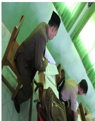
Gambar 4.28 Kepala Madrasah mengamati kinerja guru dan melihat RPP

Pernyataan tersebut diperkuat oleh hasil observasi lain pada sabtu tanggal 19 Mei 2018 pukul 09.00 WIB, dengan pelaksanaan supervisi kunjungan kelas yang mana guru sedang mengajar di depan dengan menggunakan perangkat pembelajaran dan supervisor mengamati serta meneliti perangkat pembelajrandi belakang. 215 Adapun dokumentasi dari kegiatan tersebut: 216