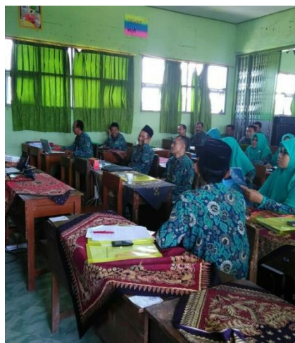
Gambar 4.25 Supervisi dengan teknik kelompok

Pernyataan tersebut diperkuat oleh hasil observasi lain pada tanggal 19 Mei 2018, dengan pelaksanaan supervisi kelompok dilaksanakan di ruang guru . 201 Hal ini dikuatkan oleh dokumentasi berikut. 202