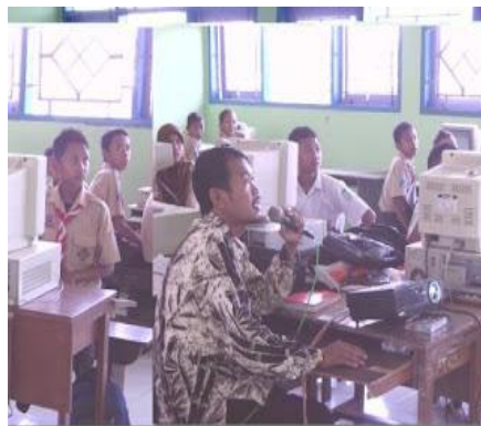
Gambar 4.13 pengadaan LCD dalam pembelajaran

Pernyataan diatas diperkuat oleh hasil observasi lain pada tanggal 5 Mei 2018, adanya pengadaan LCD ketika pelaksanaan kegiatan pembelajaran. 149 Adapun dokumentasinya sebagai berikut: 150