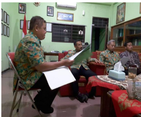
Gambar 4.3 supervisi khusus di kantor oleh kepala madrasah

Wawancara diatas diperkuat oleh hasil observasi pada hari sabtu tanggal 2 Mei 2018 pukul 09.00 WIB yang mana peneliti datang kelokasi penelitian ketepatan bapak kepala madrasah mengadakan supervisi khusus dikantor. 103 Adapun dokumentasinya sebagai berikut: 104