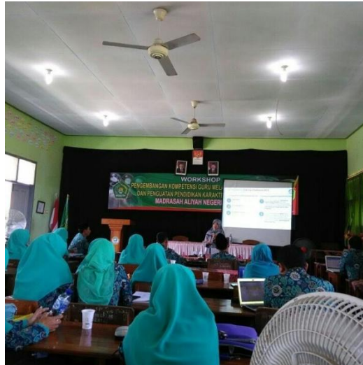
Gambar 4.35 sharing dan pemberian support peningkatan kompetensi guru