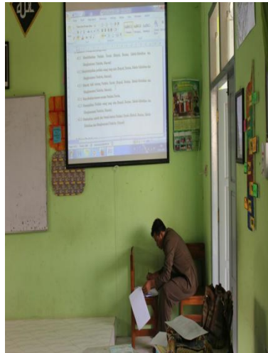
Gambar 4.27 Guru mengajar saat kegiatan kunjungan kelas

Pernyataan tersebut diperkuat oleh hasil observasi lain pada tanggal 19 Mei 2018, dengan pelaksanaan supervisi kunjungan kelas yang mana guru sedang mengajar di depan dengan menggunakan perangkat pembelajaran. 212 Adapun dokumentasi kegiatan tersebut adalah: 213