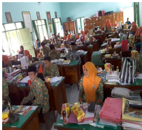
Gambar 4.15 Tambahan support dari Kepala Madrasah di ruang guru

Pernyataan diatas diperkuat oleh hasil observasi lain pada tanggal 7 Mei 2018, yang ketepatan ada kegiatan rapat dengan guru-guru berprestasi sebagai supervisor team teaching dan diskusi guru serta pemberian support dari kepala madrasah. 155 Hal tersebut didukung oleh dokumentasi berikut: 156