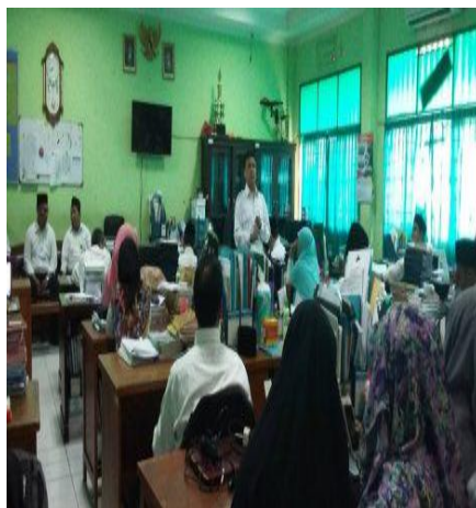
Gambar 4.31 Rapat tindak lanjut kegiatan supervisi

Pernyataan tersebut diperkuat oleh hasil observasi lain pada tanggal 23 Mei 2018, dengan adanya rapat tindak lanjut dari kegiatan supervisi. 226 Hal tersebut didukung dokumentasi sebagai berikut. 227