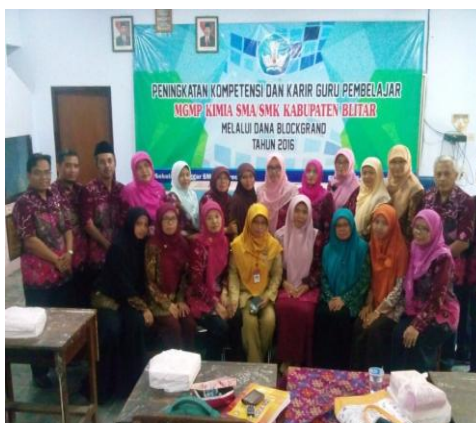
Gambar 4.5 kegiatan tindak lanjut penataran guru

Data tersebut diperkuat oleh hasil observasi pada tanggal 5 mei yang mana di madrasah ada kegiatan follow up peningkatan kompetensi dan karir guru. 114 Adapun dokumentasi dari hal tersebut sebagai berikut: 115