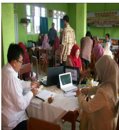
Gambar 4.21 Workshop

Data tersebut diperkuat oleh hasil observasi lain pada rabu tanggal 23 Mei 2018 pukul 13.45 WIB, yang mana disitu sedang mengadakan workshop oleh supervisor, guru senior dan wakil kepala sekolah. 185 Adapun dokumentasi terkait hal diatas sebagai mana di bawah ini: 186