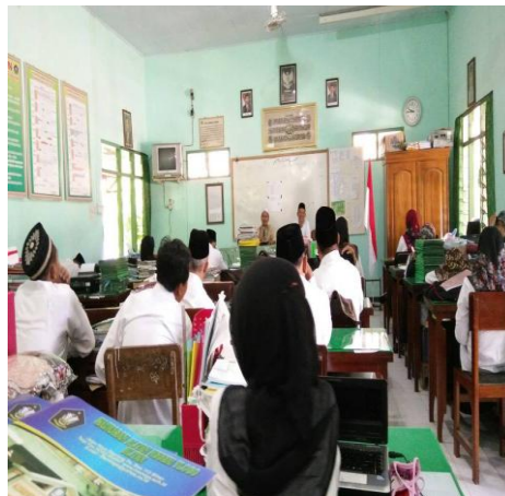
Gambar 4.6 Tindak lanjut supervisi untuk meningkatkan profesional guru

Data tersebut diperkuat oleh hasil observasi pada tanggal 23 April 2018 yang mana di madrasah ada kegiatan tindak lanjut supervisi untuk meningkatkan kompetensi profesional guru guru. 120 Adapun dokumentasi hal tersebut: 121