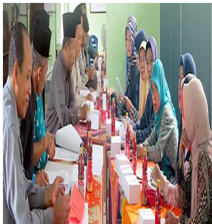
Gambar 4.32 Pendekatan Supervisi membahas problem pembelajaran

mengadakan rapat tindak lanjut bersama guru dengan cara sharing . 230 Hal ini di dukung dokumentasi sebagai berikut: 231