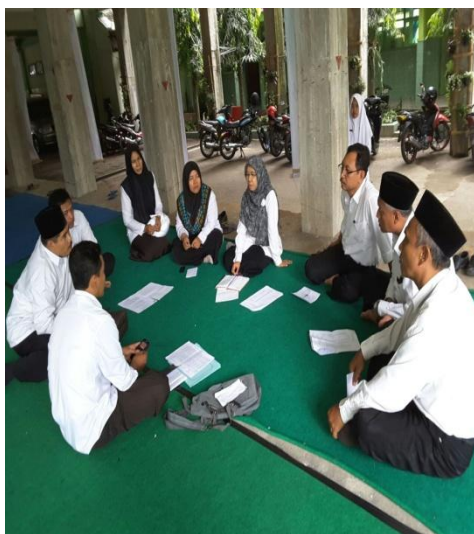
Gambar 4.7 Pendekatan personal kepala madrasah dengan para guru

Kegiatan supervisi memang secara langsung menjadi kewajiban dari kepala sekolah. Konteks supervisi di Indonesia tercakup dalam konsep pembinaan dan pengawasan. Kepala madrasah mengungkapkan: