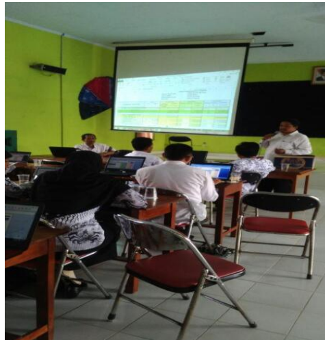
Gambar 4.34 workshop peningkatan pembelajaran

pembelajaran dari pihak madrasah. 245 Adapun dokumentasi terkait hal tersebut sebagai berikut: 246