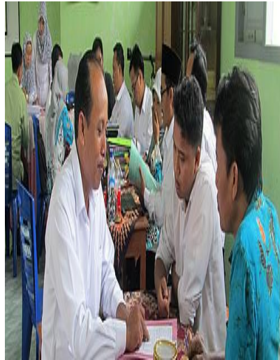
Gambar 4.20 Pemantauan oleh guru senior dan wakasek

Kepala madrasah dalam menerapkan rencana supervisi klinis ialah melihat dan menilai prototipe masing-masing guru untuk memudahkan pada tahap pelaksanaan supervisi klinis. Guru memiliki kecenderungan masing – masing melihat latar belakang pendidikan yang sangat beragam sehingga wawasan antara guru yang satu dengan yang lainnya sangat berbeda sehingga sangat diperlukan sebuah strategi yang cocok dan sesuai dengan tipe masing – masing guru agar kegiatan supervisi klinis bisa memperoleh sebuah hasil yang maksimal.