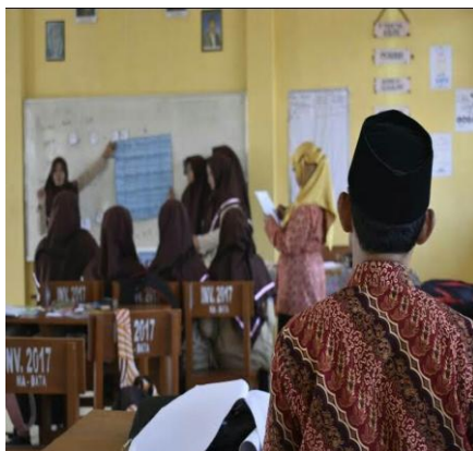
Gambar 4.8 Kunjungan kelas dengan melihat administrasi pembelajaran sesuai rpp