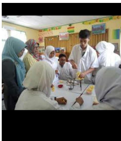
Gambar 4.24 Supervisi individu dari guru senior

Pernyataan Wawancara di atas diperkuat oleh hasil observasi lain pada tanggal 16 Mei 2018, dengan pelaksanaan supervisi di kelas yang dilaksanakan oleh supervisor yang sudah di tunjuk oleh guru. 198 Adapun dokumentasinya: 199