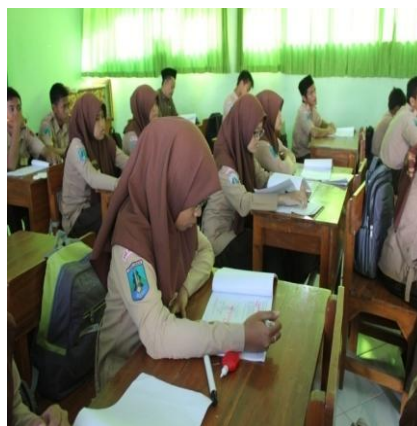
Gambar 4.26 Supervisi Kelas tidak mengganggu proses pembelajaran

Dokumentasi terkait hal tersebut sebagai berikut. 207