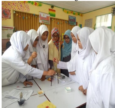
Gambar 4.37 peningkatan kompetensi guru dengan memaksimalkan pembelajaran

Adapun dokumentasi terkait hal diatas sebagai berikut: 257