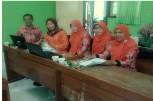
Gambar 4.14 guru berprestasi dan supervisor team teaching

Pendapat ini dikuatkan oleh seorang guru yang menyatakan bahwa: