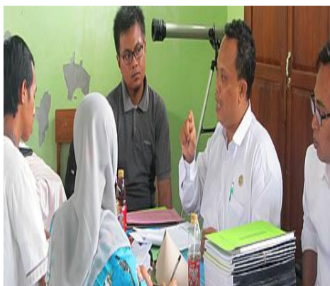
Gambar 4.22 Hubungan antara kepala sekolah dan guru sebagai partner

Wawancara di atas tersebut diperkuat oleh hasil observasi lain pada tanggal 16 Mei 2018, ketepatan di kantor mengadakan rapat anggota supervisor yang terdiri dari guru-guru yang sudah ditunjuk untuk membantu kepala madrasah mensupervisi. 191 Adapun dokumentasi yang terkait sebagai berikut: 192