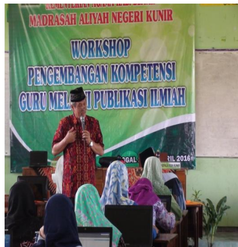
Gambar 4.23 Pengembangan Kompetensi

Wawancara di atas tersebut diperkuat oleh hasil observasi lain pada tanggal 25 Mei 2018, sedang diadakan workshop peningkatan kompetensi guru. 195 Hal tersebut didukung oleh dokumentasi berikut: 196