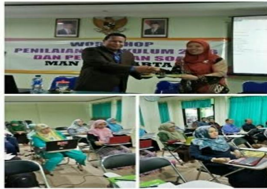
Gambar 4.36 workshop dan penyerahan piagam guru

Pasca adanya kegiatan supervisi klinis, pada dasarnya tujuannya ingin memotivasi agar guru meningkatkan kinerja. Pada tahap ini kepala madrasah dan guru bersama – sama menganalisis data hasil observasi. Tidak itu juga setelah adanya kegiatan supervisi klinis kepala madrasah memberikan reward kepada guru-guru yang dianggap bagus dalam proses pembelajarannya antara lain; piagam yang nantinya bisa digunakan untuk kenaikan pangkat, kemudian mengikuti kursus – kursus , workshop, dan diklat – diklat yang tidak hanya sampai kabupaten melainkan sampai provinsi untuk menambah wawasan mereka dan pentingnya lagi piagamnya bisa digunakan juga untuk kenaikan pangkat. Tetapi sesungguhnya peningkatan kinerja guru bukanlah akhir dari diadakannya supervisi. Peningkatan mutu dari lembaga pendidikan yang ada merupakan tujuan utama dari pelaksanaan supervisi.