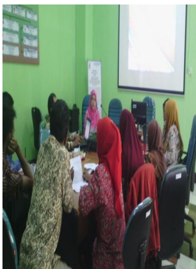
Gambar 4.1 planing supervisi

Data tersebut diperkuat oleh hasil observasi lain pada hari senin tanggal 23 April 2018 pukul 13.00, yang mana peneliti datang ke lokasi penelitian dan ternyata disitu kepala madrasah sedang mengadakan rapat perencanaan pelaksanaan supervisi. 93 Berikut dokumentasinya: 94